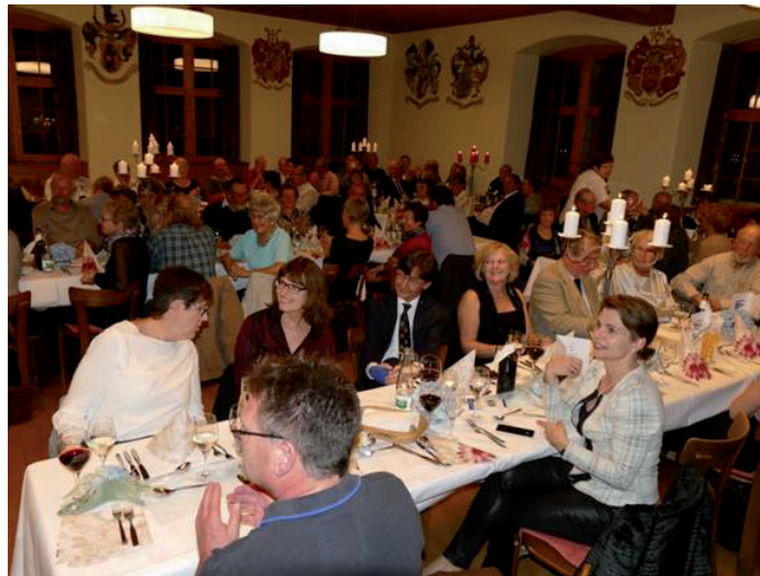
Clubabend 2017 mit grosser Beteiligung