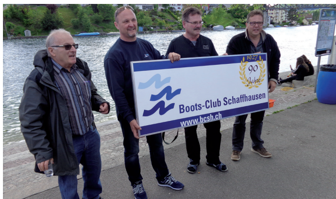
Einweihung Clubtafel am 20. Mai 2017

Die Anwesenden erhalten vom Präsidenten ein Pin des Boots-Clubs, weitere sind für Fr. 3.00 erhältlich im Sekretariat. Ausserdem liegen Flyer des Clubs sowie zum Thema Motorenklau auf.