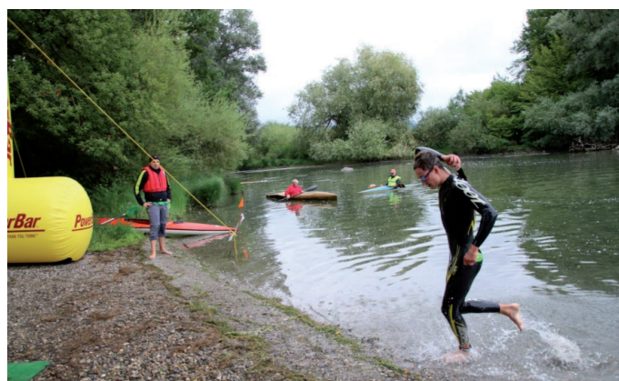
Schwimmausstieg beim Schaffhauser Triathlon

Weitere Informationen finden Sie auf unserer Website www.bcsh.ch oder informieren Sie sich bei Regula Möckli 052 680 21 38 oder 079 816 39 09)