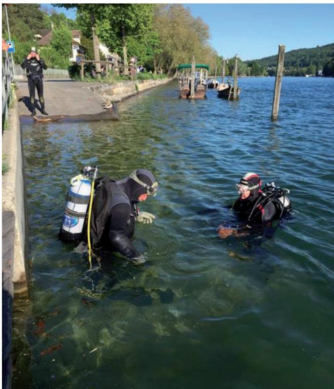
Rhyputzete mit dem Tauchclub

Der Vorstand wird in globo einstimmig wiedergewählt.