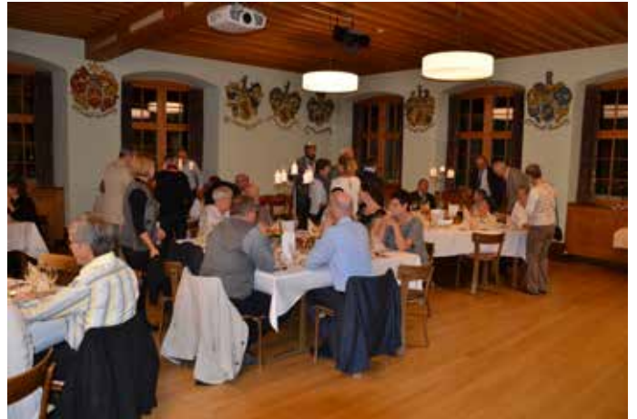
Am 4. November 2018 fand der Clubabend statt.

Der Präsident weist darauf hin, dass der Vorstand gerne Vorschläge für Clubanlässe annimmt.