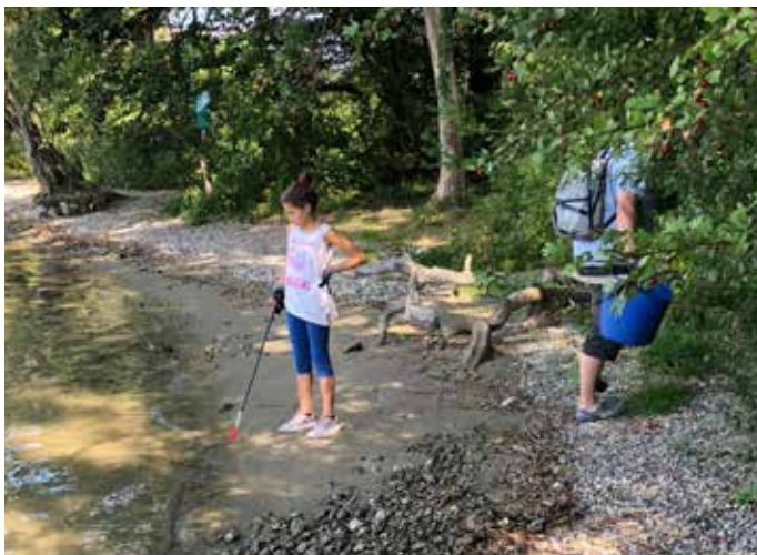
Rheinputzete am Clean-Up-Day

Der Vorstand weist auf den Stamm des BCSH hin, der jeden zweiten Dienstag im Monat stattfindet im Restaurant Altes Schützenhaus (ausser am 2.4.2019,